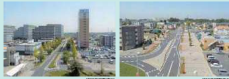
※みそのウイングシティとは・・・未来へ飛び立つ鳥のような地域の形状と、しさをイメージした埼玉スタジアム2002の形状を表現したもので、浦和美園・岩槻南部地域4の土地回整理事業地区の要約です。