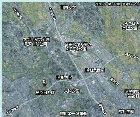
みそのウイングシティ周辺状況